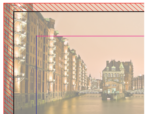
Ihr Motiv inklusive Beschnittzugabe